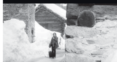
Come un morto ad Acapulco