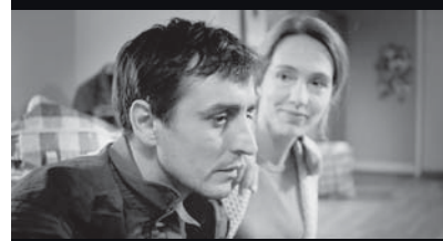
Unter der Haut