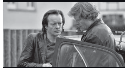
Der Goalie bin ig