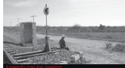
Jugando con los pajaros