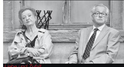
Liebe und Zufall