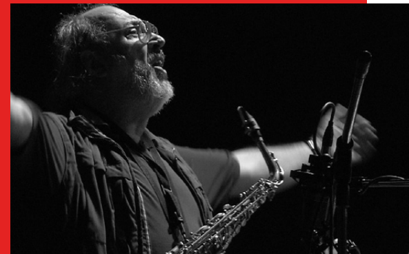
Sounds and Silence