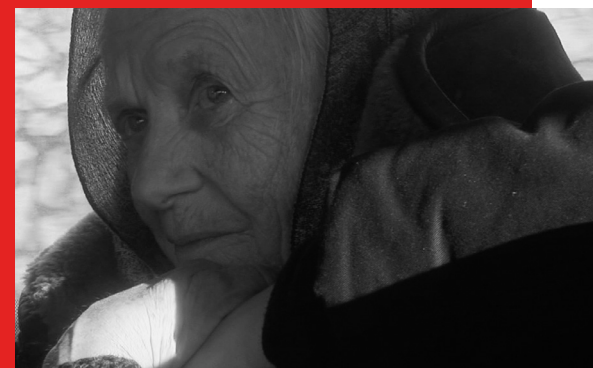
Die Frau mit den 5 Elefanten